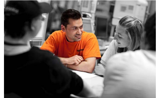
Respect for the individual